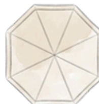
M - Venor rapid shelter 22