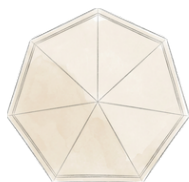
S - Venor rapid shelter 16