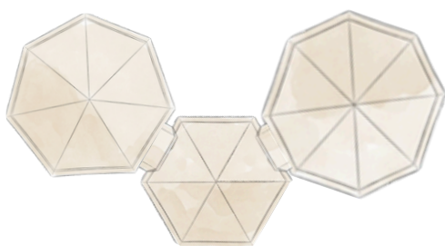
L - Venor rapid shelter 16 + 22 + Connect