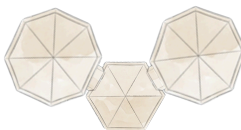
XL - Venor rapid shelter 22 + 22 + Connect